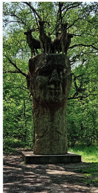
Le Gardien, de l'artiste franco-allemande Gloria Friedmann, dans la forêt de Rougeau.