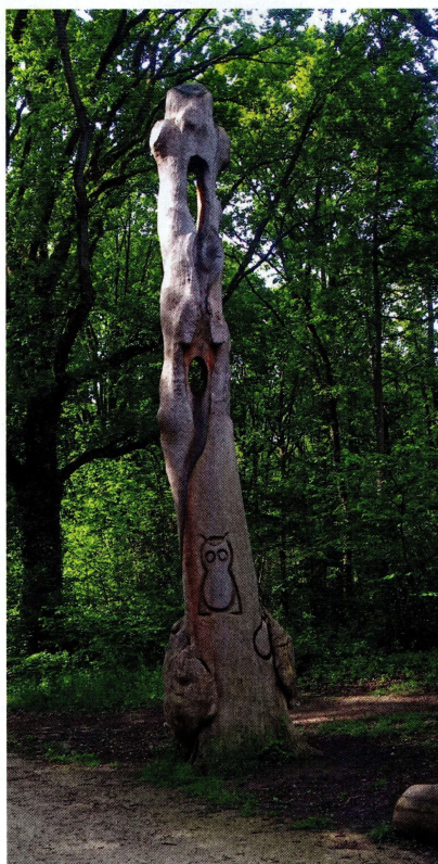
Totem dans la forêt des Grands Avaux.