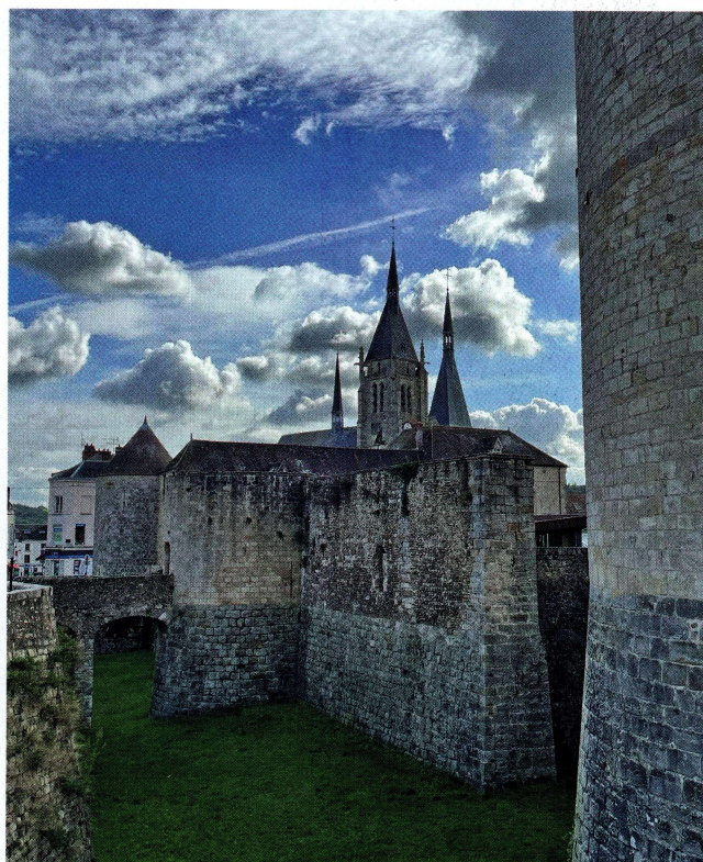
Le château de Dourdan.