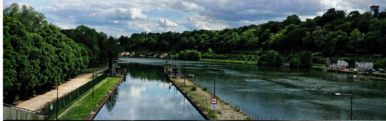
La Seine au Coudray-Montceaux.

Il n'y a plus d'excuses pour ne pas venir visiter ces beaux terrains de jeu !