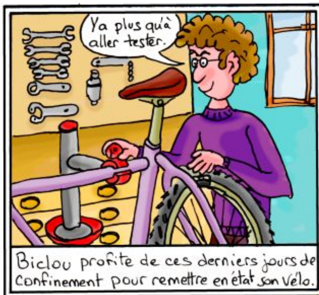
Biclou profite de ces derniers jours de confinement pour remettre en état son vélo.