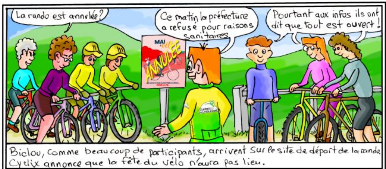
Biclou, comme beaucoup de participants, arrivent sur le site de départ de la rando. Cyclix annonce que la fête du vélo n'aura pas lieu.