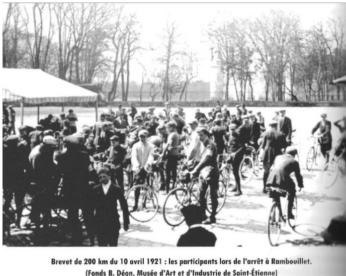
Brevet de 200 km du 10 avril 1921 : les participants lors de l'arrêt à Rambouillet.

Le 1er Brevet de Randonneur 200 est organisé en septembre 1921 sur le parcours PARIS – DREUX – CHARTRES – PARIS.