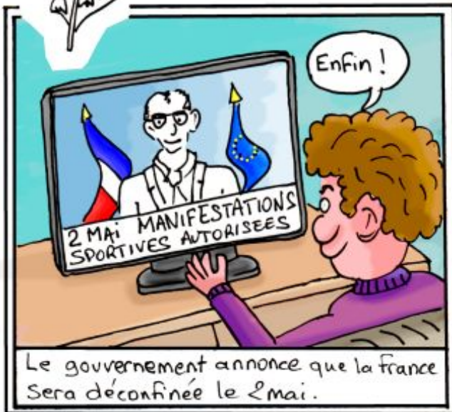
Le gouvernement annonce que la France sera déconfinée le 2 mai.