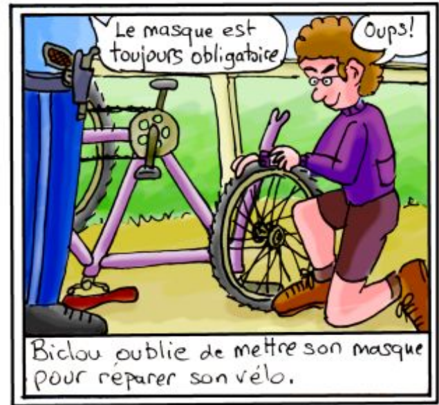
Biclou oublie de mettre son masque pour réparer son vélo.