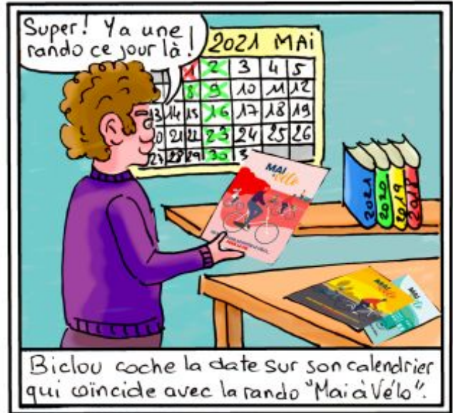
Biclou coche la date sur son calendrier qui coïncide avec la rando "Mai à Vélo".